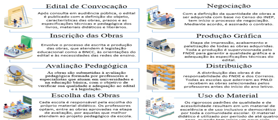
Figura 1: Funcionamento do PNLD

O Programa Nacional do Livro e do Material Didático (PNLD) é uma política de Estado responsável pela avaliação, aquisição e distribuição de obras didáticas, pedagógicas e literárias, entre outros materiais de apoio à prática educativa. De modo sucinto, o funcionamento deste Programa está ilustrado na Figura 1: