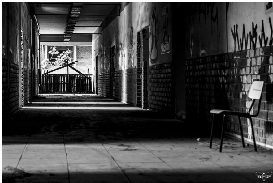
Figura 6 – Bloco I 24. Imagem fotográfica. 14x21cm. Autor: William Cazavechia, 2023.