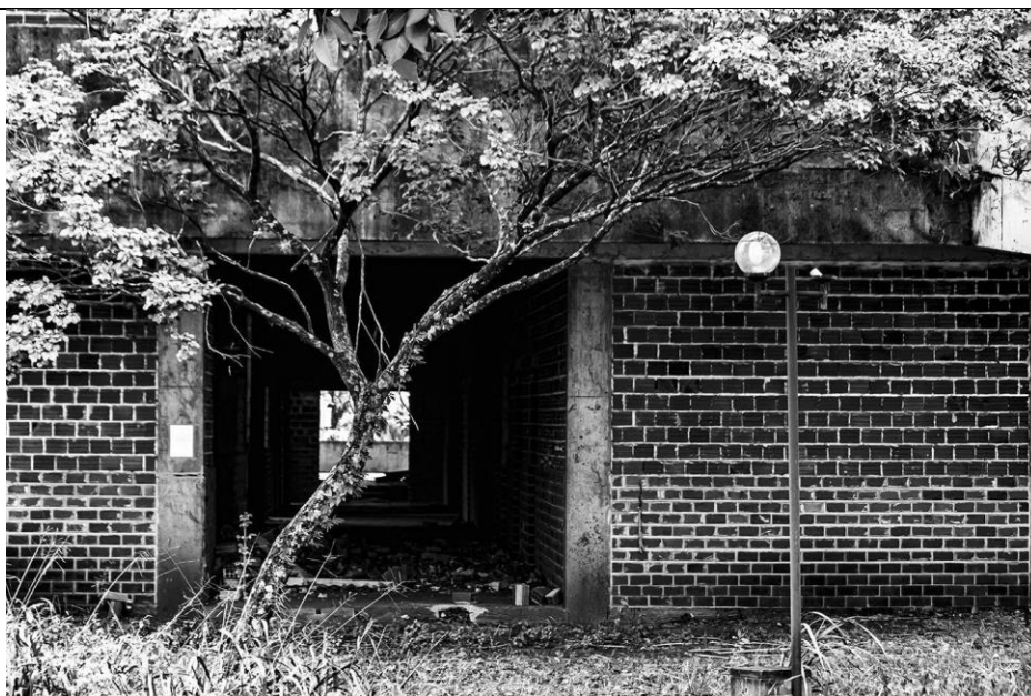
Figura 1 – Bloco F 90. Imagem fotográfica. 14x21cm. Autor: William Cazavechia, 2023.