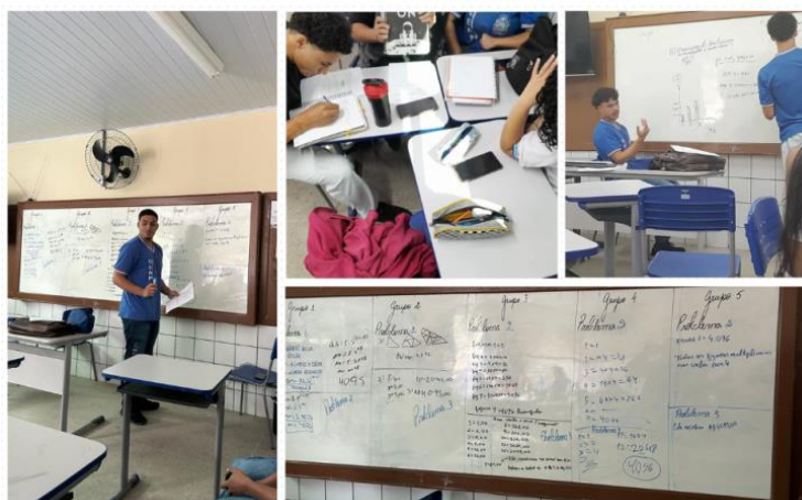
Figura 1 – Estudantes apresentando suas resoluções e quadro de resoluções

A figura 1 ilustra as etapas, a plenária e o quadro de resoluções das atividades aplicadas. Agora, o professor dividiu o quadro em cinco partes para mostrar as resoluções de cada grupo.