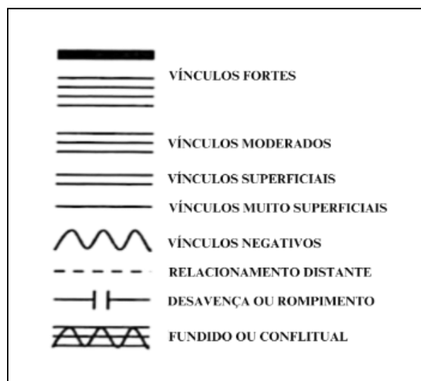
Figura 3: Psicofigura de Mitchell.

Esses instrumentos, ao serem combinados, possibilitam uma abordagem holística e interdisciplinar, eficaz para abordar fenômenos tão complexos quanto as vivências familiares em situações de violência contra crianças e adolescentes. Sua utilização não apenas amplia o alcance dos dados coletados, mas também contribui para uma análise mais rica e significativa, respeitando as particularidades e demandas das famílias envolvidas.