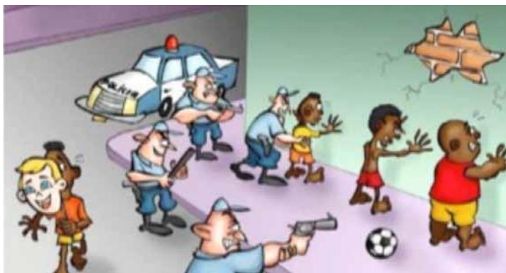
Figura 2: Charge síntese do Pele negra, máscaras brancas (Fonte: Faustino, 2016)