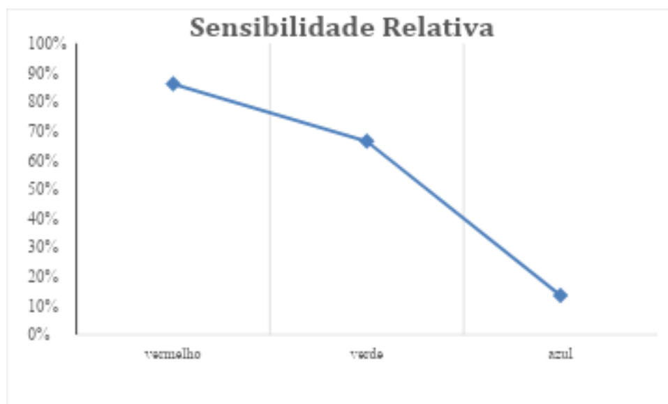
Figura 2 – Sensibilidade do LDR relativa à luz branca.

energia discreta, dualidade onda-partícula. (e) Diferenciar efeito fotoelétrico e efeito fotovoltaico. (f) Contextualizar a aplicação dos fenômenos para efeitos fotoelétricos e/ou fotovoltaicos, como por exemplo o abrir e fechar portas dos elevadores automaticamente” e aplicações das células solares.