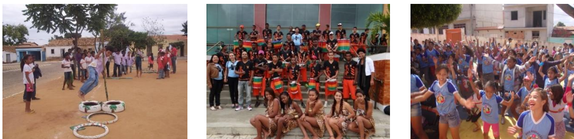
Ilustração 02: Oficinas Desenvolvidas no Município de Caetitê pelo PME