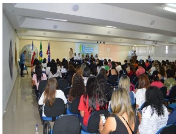
Ilustração 01: Encontros do Comitê Territorial Baiano de Educação Integral Integrada

Fazendo uma análise do quadro, apontamos que a maior parte das atividades foram realizadas na capital baiana. Isso se deve a dimensão territorial do Estado da Bahia que dificulta o acesso aos diversos recantos do estado, ficando mais acessível o deslocamento para Salvador. Os municípios se prontificam a sediar o evento com oferta da logística local para o evento: local, lanches, materiais, etc e, os demais participantes assumem todas as despesas das suas equipes: transporte, alimentação, hospedagem, etc.