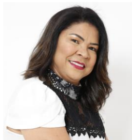
Foto de rosto

Doutorado em Educação pela Universidade Federal de São Carlos - UFSCar (2016). Professora Titular da Universidade Estadual do Sudoeste da Bahia - UESB. Tem experiência na área de Educação, atuando principalmente nos seguintes temas: Criança, Infância, Sociologia da Infância, Currículo, Relações étnico-raciais e diferença.