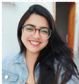
Foto de rosto