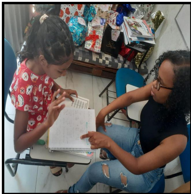
Figura 4 – A aquisição do saber por meio do desenho.