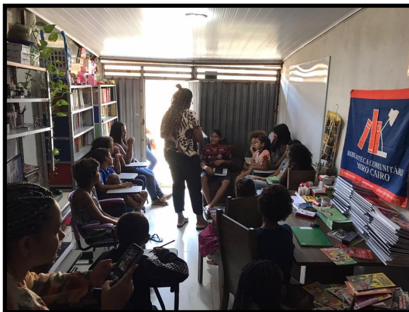
Figura 2 – Espaço da Biblioteca Comunitária Miro Cairo

A pedagogia dos multiletramentos, que é abordada no âmbito escolar, se apresenta numa nova conjuntura nos espaços de educação não formal. Nesse contexto, a multiplicidade de culturas presente nas comunidades constitui práticas socioeducacionais que proporcionam aos envolvidos uma compreensão da diversidade de linguagem existente. Rojo indica que os letramentos existentes decorrem em "[...] multiplicidade de culturas – multiculturalismo e a multiplicidade de linguagens, multissemioses e de mídia" (2012, p.135). Nesse sentido, o conceito está em consonância com a abordagem feita por Gohn (2006) sobre a definição de espaço não formal de educação, pois a aprendizagem é potencializada pelas diversas formas de linguagens na comunidade. Como podemos constatar na figura 2 abaixo: