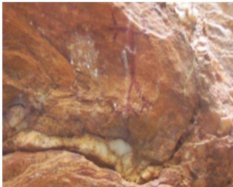
Figura 2 - Antropomórfico- Vitória da Conquista-BA