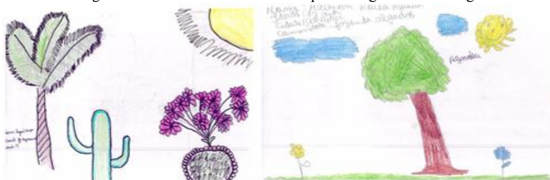
Figura 6 - Desenhos com o tema “Espécies vegetais da caatinga”

Fonte: Estudantes da Escola Municipal Helita Silveira, Caraíbas, 2023.