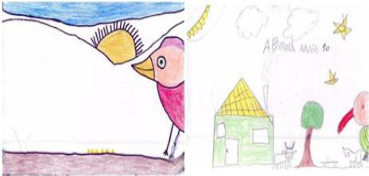
Figura 3 - Desenhos com o tema: os Passarinhos gigantes

Fonte: Estudantes da Escola Municipal Helita Silveira, Carafbas, 2023.