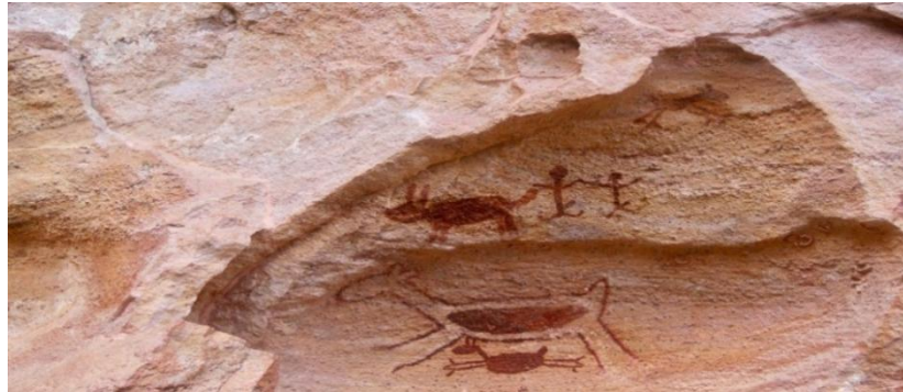
Figura 1 - Pinturas rupestres no Parque da Serra da Capivara

as datações das pinturas são de mais de doze mil anos, sendo encontradas algumas com mais de cento e dez mil anos.