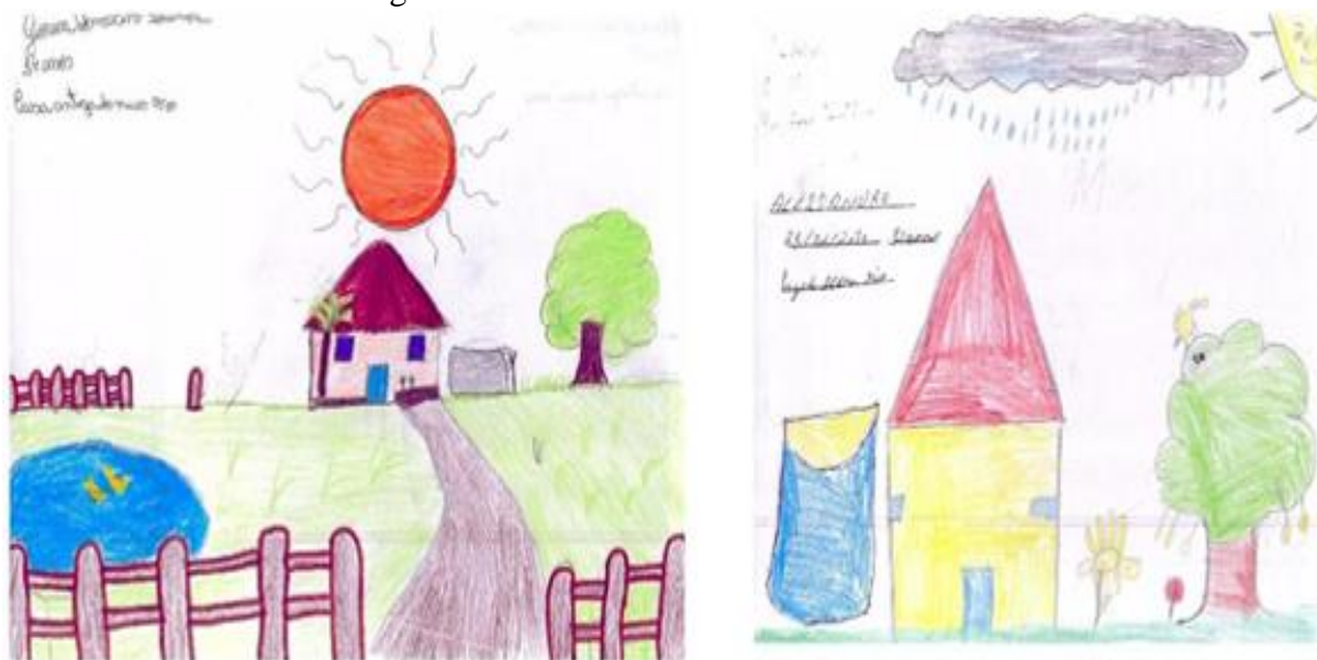
Figura 5 - Desenhos com tema “A cisterna”