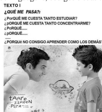
Figura 3: Tirinha da prova de linguagens, códigos e suas tecnologias, do Enem (2023)