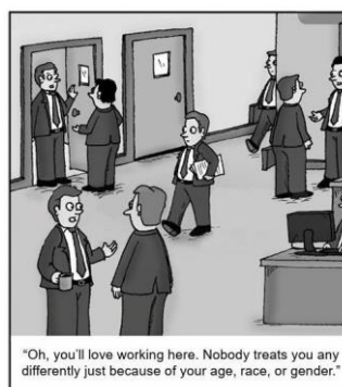
Figura 1: Tirinha da prova de Linguagens, códigos e suas tecnologias, do Enem (2023)