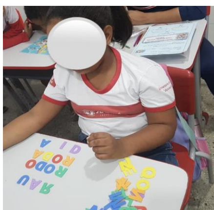
Fonte: Aluna utilizando o “Alfabeto móvel” para formar novas palavras, abril de 2023.