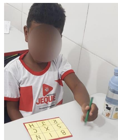
Fonte: Montagem de palavras utilizando o “Jogo das sílabas móveis”, maio de 2023.