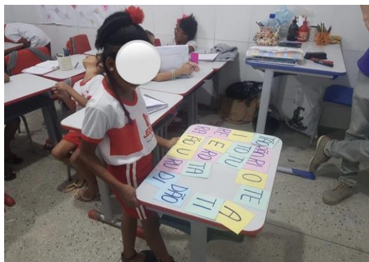
Fonte: Montagem de palavras com as famílias silábicas da palavra geradora trabalhada na semana de aula, maio de 2023.