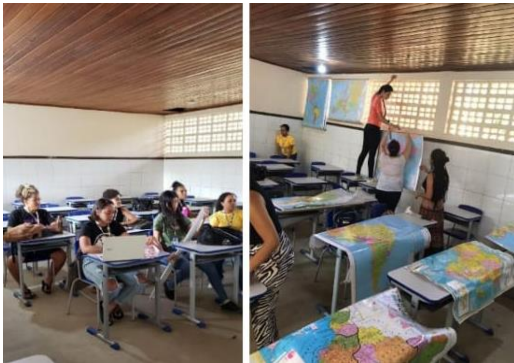
Figura 3: Organizando a sala de Geografia - CEAM.

compreensão dos diferentes territórios” (Katuta, 2011, p. 170). Os mapas que antes estavam guardados em gavetas na biblioteca passaram a ser efetivamente utilizados nas aulas e auxiliaram ricamente na compreensão dos conteúdos geográficos. Além dos mapas expusemos livros na sala como: o novo livro da área de ciências humanas introduzido com o Novo Ensino Médio e outros livros geográficos encontrados na biblioteca.