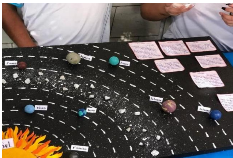
Figura 2: Projeto do sistema solar/ Feira de ciências no CEAM. Fonte: Talita de Novais Almeida e Ilara Santos Lemos, Vitória da conquista- BA, 2022.

figura 2). Além disso, ocorreu a festa junina, o dia da mulher, dia dos povos indígenas, entre outras atividades que nos fizeram também perceber os pontos negativos do CEAM. Como no que se refere à estrutura do colégio essa se mostra precária em alguns sentidos, de modo que, o ensino não alcança a qualidade pretendida para os alunos. De acordo com Plank (2001), a baixa infraestrutura, sempre foi um dos maiores óbices da maioria das escolas brasileiras, sendo uma questão permanente que precisa ser evidenciada e discutida para que soluções sejam encontradas.