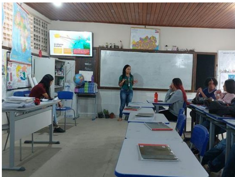
Figura 4: Aula ministrada na turma do 3º ano B com o tema Mudanças Climáticas. Fonte: Talita de Novais Almeida e Ilara Santos Lemos, Vitória da conquista- BA, 2023.

conhecimento de assimilação imediata” (Moran, 2000, p. 20), justamente, o que ocorreu em nossa aula, haja vista que não tínhamos muito tempo para abordar o assunto. E, por fim, aplicamos uma atividade com questões do ENEM e Vestibulares que abordam o tema, para diagnosticar quanto de conhecimento pôde ser construído com os estudantes.