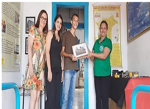
Figura 4: Entrega/Doação dos livros-álbum ao Arquivo Público Municipal de Brumado-BA- 2022