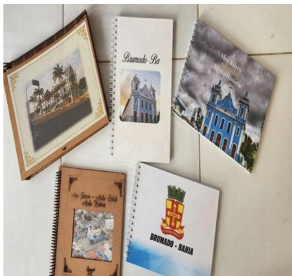
Figura 5: Livro/Álbum produzido pelos alunos sobre a urbanização de Brumado-BA, 2022

do modo de vida e das intencionalidades das pessoas que compartilham aquele espaço registrados nas figuras 5 e 6.