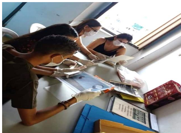
Figura 1: Visita dos alunos ao Arquivo Público Municipal de Brumado-BA, 2022

O desafio foi utilizar as diversas fontes para desvendar a história da cidade. Assim, os alunos embarcaram em uma jornada de pesquisa orientada pelo professor. Foram utilizados materiais bibliográficos, como livros e informações online, a procura de pistas sobre o passado da cidade. Foi realizado o levantamento e análise de fotografias antigas, o que permitiu a construção de narrativas sobre a vida em outros tempos. Ocorreu uma aula de campo com visita guiada ao arquivo público municipal, onde os alunos descobriram um verdadeiro “baú de tesouro” histórico com documentos e registros que ajudaram a revelar a história da cidade, como se pode observar nas figuras 1 e 2.