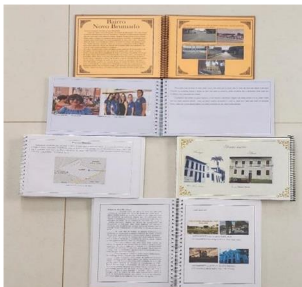
Figura 6: Livro/Álbum produzido pelos alunos sobre a urbanização de Brumado-BA, 2022