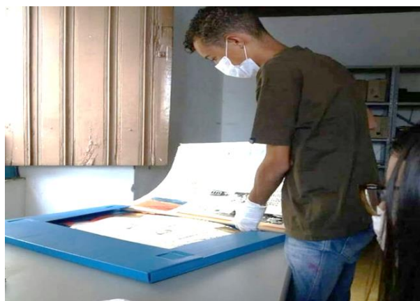
Figura 2: Visita dos alunos ao Arquivo Público Municipal de Brumado-BA, 2022