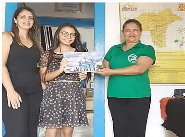
Figura 3: Entrega/Doação dos livros-álbum ao Arquivo Público Municipal de Brumado-BA, 2022

Como produto final os alunos produziram livros-álbum descrevendo todas as informações coletadas sobre a cidade a partir dos bairros. Dentre os livros produzidos foram escolhidas produções que foram entregues ao Arquivo Público Municipal de Brumado. Conforme se observa nas figuras 3 e 4.