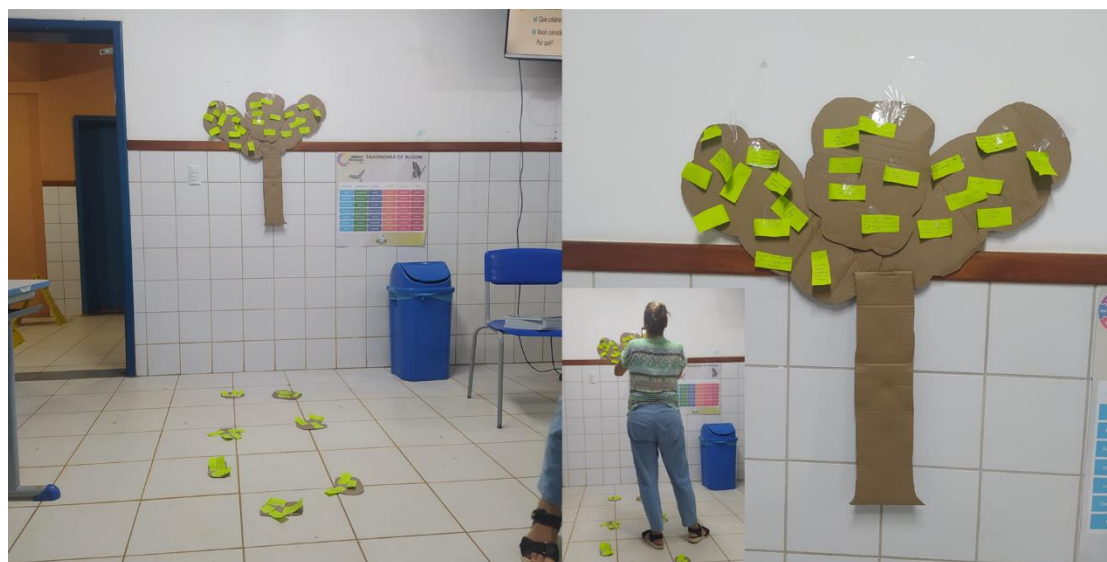
Figura 2 – Dinâmica Estrada de Pedras e Árvore dos Sonhos para introduzir sobre Alimentação Saudável

As respostas da primeira pergunta foram postas nas pedras, enquanto que as respostas da segunda pergunta foram postas na árvore. Ambas foram escritas em notas adesivas pelos estudantes (Figura 2). Em seguida, a professora regente auxiliou na leitura das respostas postas.