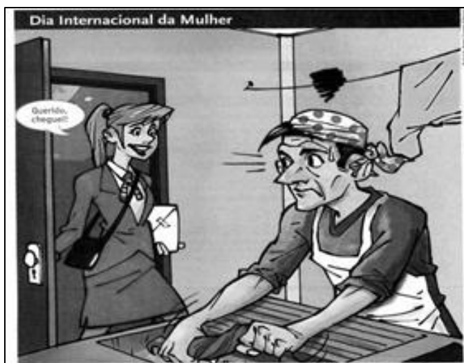
Imagem 2- Livro didático Linguagem e Códigos do Ensino Médio- Capítulo 5 “Asociedade e seus costumes” da Etapa 2, Unidade 1 denominada “Visões”, 2016,p. 226-230.

Logo em seguida, o capítulo “A sociedade e seus costumes” propõe uma leitura de Charge, intitulada como “Dia Internacional da Mulher”. A imagem 2 traz uma mulher branca, com vestimenta formal, em diálogo com o seu cônjuge. E diz: - “Querido, cheguei!”. Em contrapartida, o homem, também branco, com roupas informais, mostra insatisfação na realização dos trabalhos domésticos; sua aparência é de uma pessoa cansada e chateada, enquanto a mulher mostra-se feliz.