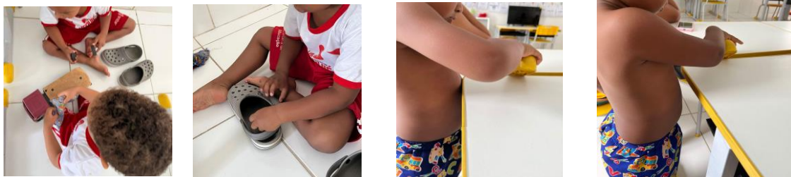
Imagem 01: Brincadeiras imaginárias – os carrinhos