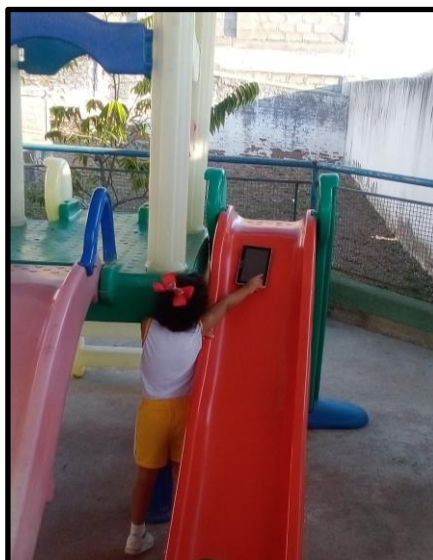
Figura 2: Brinquedos que escorregam