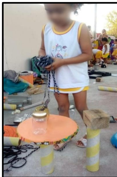
Figura 1: A mesa