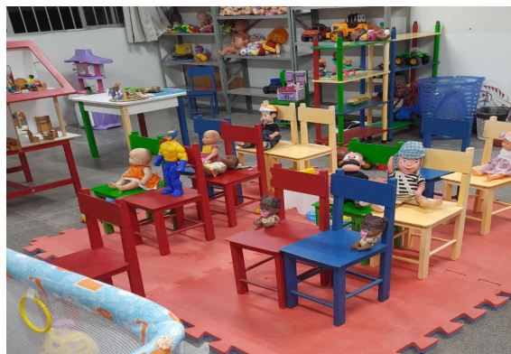
Figura 03 - “Ônibus escolar de viagens”