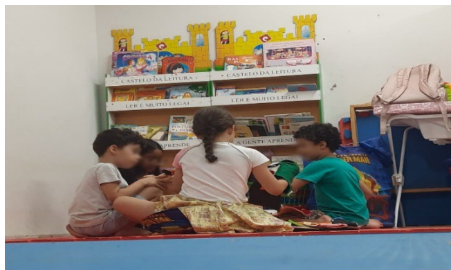
Figura 02 - Crianças brincando de fantoche