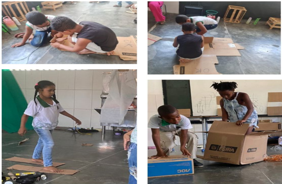
Figura 5- Crianças brincando com as caixas de papelão