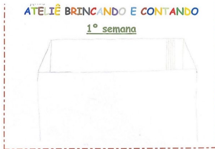
Figura 3 - Desenho de participante Warao do 1º encontro- do que eu brinquei

imagens, as significações simbólicas que constituem uma parte da impregnação cultural à qual está submetida” (Brougère, Gilles, 1995, p. 47).