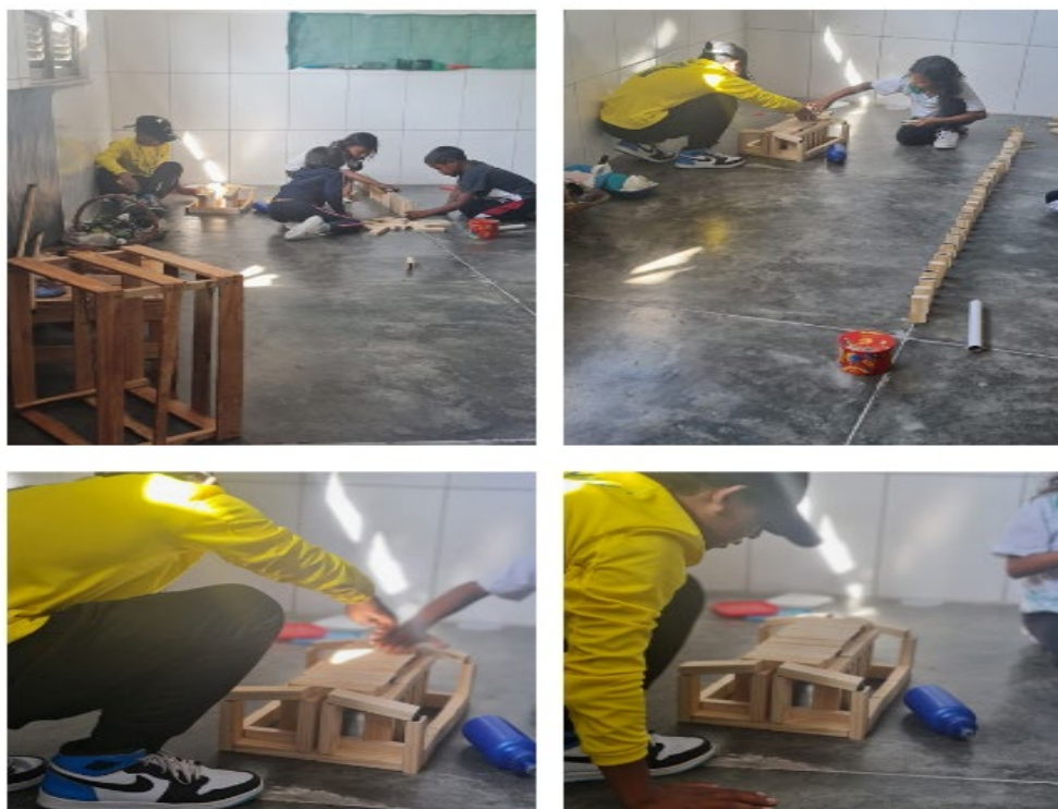
Figura 2- Participantes produzindo brincadeiras no Ateliê.

Os encontros no Ateliê aconteceram durante 6 seis semanas e tinham duração de 1 hora, antes do recreio. No primeiro encontro, os olhares atentos e curiosos, exploravam os materiais, e logo um primeiro grupo composto pelas crianças Venezuelanas de etnia indígena Warao , sentaram em um espaço com blocos de madeiras espalhados e começaram a montar e empilhar os blocos, conforme figura 2: