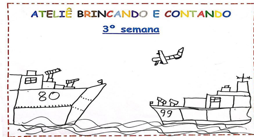
Figura 7- Desenho de participante Warao do 3º encontro- do que eu brinquei

Tais observações sobre a brincadeira foram comprovadas, conforme representação abaixo, feita por um participante Warao .