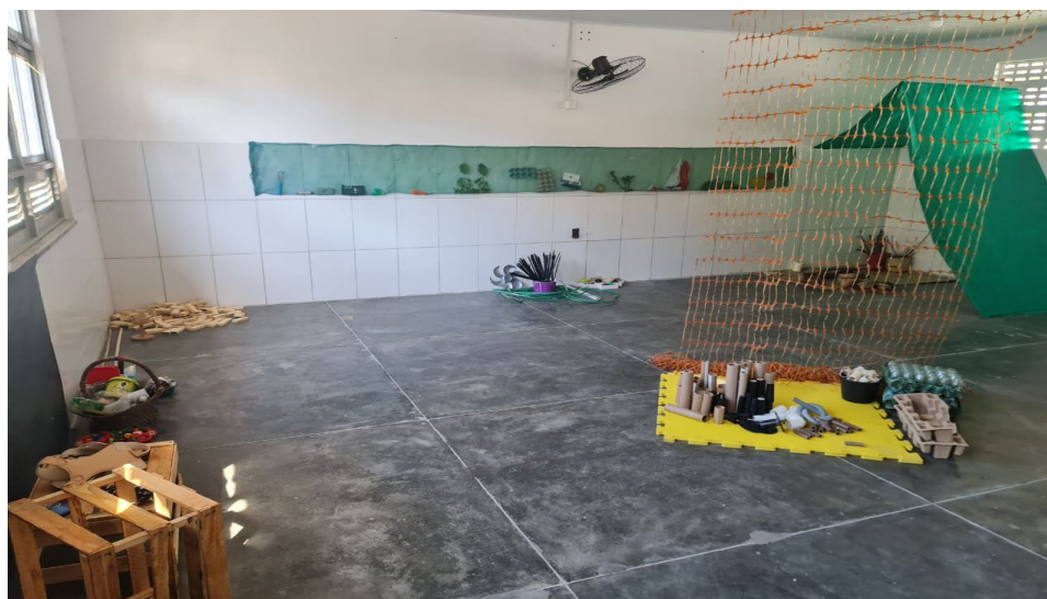
Figura 1- Visão central do ateliê