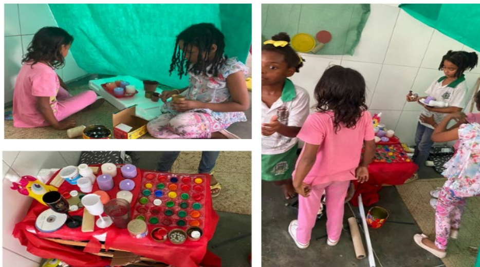
Figura 8- Festa de aniversário na cabana

colegas, fato que nos encontros iniciais eram pouco observados, uma vez que eles brincavam com os seus pares, no grupo reduzido.