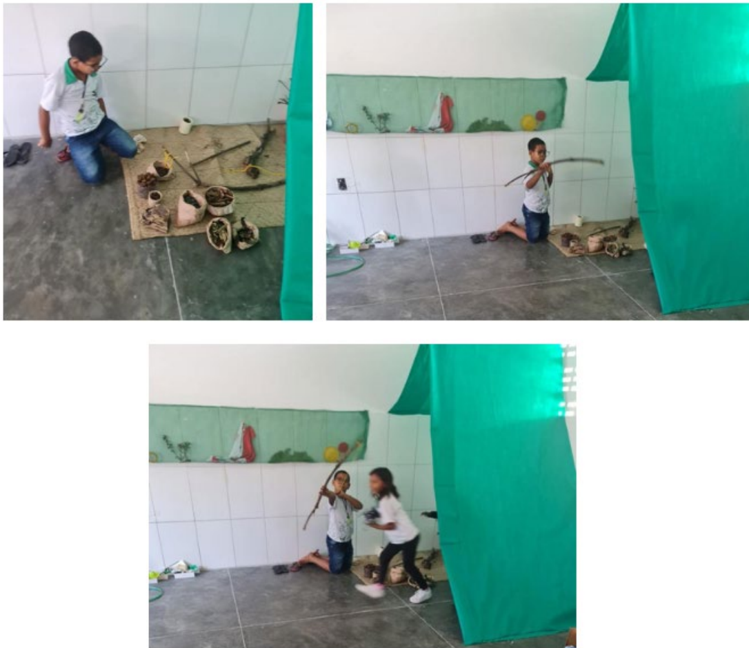
Figura 4- Criança explorando o cantinho com elementos da natureza