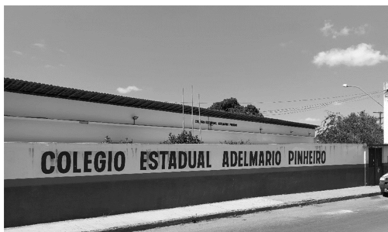
FIGURA 01 - Colégio Estadual Adelmário Pinheiro (CEAP)

O relato foi resultado das ações desenvolvidas pelo Programa de Residência Pedagógica (PRP), Subprojeto de Geografia/UESB, no Colégio Estadual Adelmário Pinheiro (Figura 1). A escola possui turmas do Ensino Médio do 1º ao 3º ano, localizado no bairro Alto Maron, rua Nestor Fonseca, número 516, na cidade de Vitória da Conquista (BA).