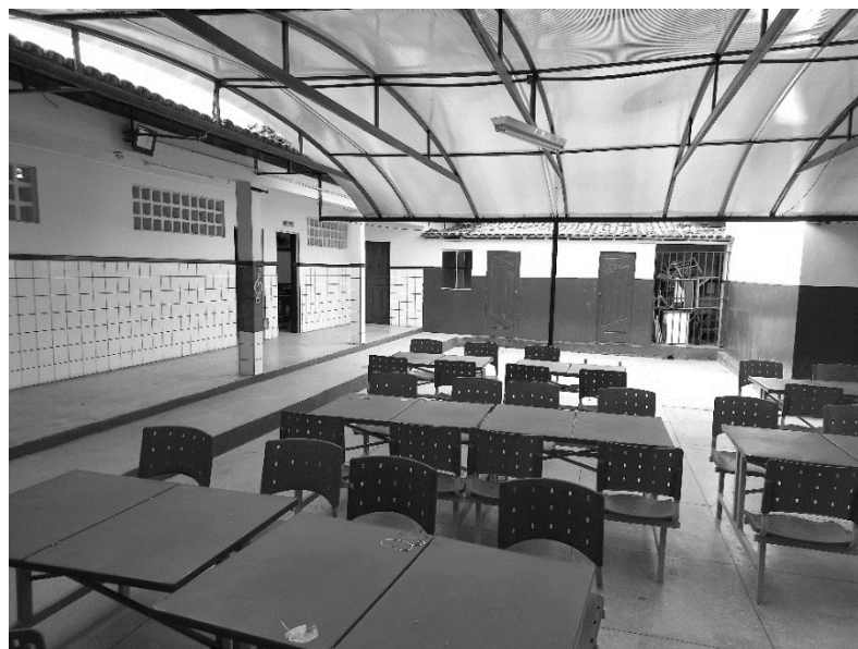
FIGURA 02 – Parte do pátio coberto pelo toldo, com mesas, refeitório, e salas de aula.

A estrutura da escola se assemelha à de outros colégios também estaduais. As salas são bem arejadas, iluminadas por luz natural e com cerca de 2 lâmpadas, cada uma possui uma televisão de plasma onde é possível exibir mídias. O pátio (Figura 2) possui uma cobertura no centro, composto por mesas e cadeiras onde os estudantes realizam as refeições, tais como lanches e almoço. Pode-se encontrar carteiras danificadas e mais antigas, as salas comportam turmas de até 40 (quarenta) alunos.