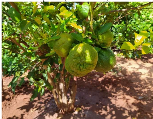
Foto 3: Laranjeira no quintal da casa de camponesa, Curral Novo, 2024