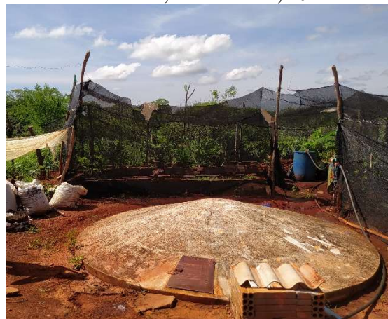
Foto 4: Caixa adquirida pelo projeto Bahia Produtivo, Curral Novo, 2024