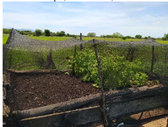
Foto 2: Plantação de hortaliças próxima ao tanque, Curral Novo, 2024