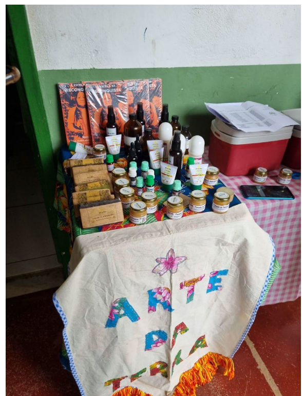
Figura 4: Mesa de óleos essenciais ‘Arte da Terra’ fabricados no Assentamento Terra Vista.

04 de outubro de 2023.