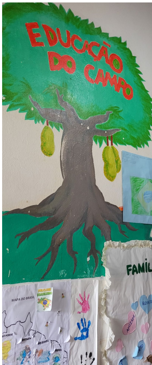
04 de outubro de 2023.