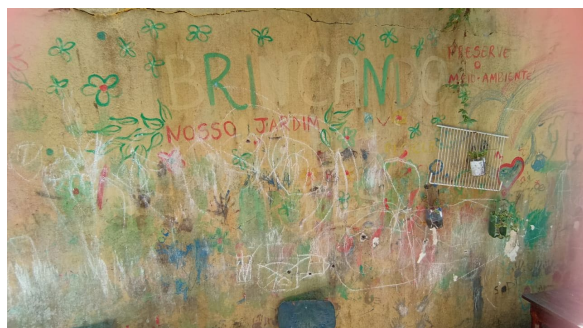
Figura 7: “Brincando Nosso Jardim; Preserve o Meio Ambiente”, em torno das letras, nota-se o desenho livre feito pelas crianças.