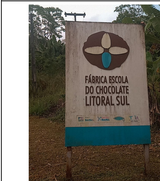
Figura 3: Fábrica Escola do Chocolate Litoral Sul no Assentamento Terra Vista.

Fonte: Acervo da aula de campo. 04 de outubro de 2023.