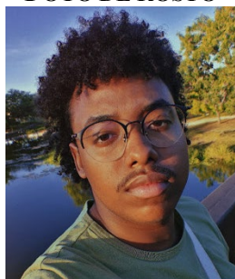
FOTO DE ROSTO