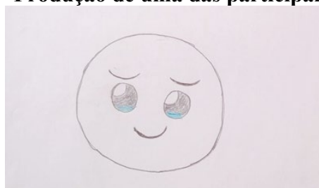
Figura 4 - Produção de uma das participantes

O momento foi marcado por descontração, reflexão e emoção para alguns participantes. Houve estudantes que destacaram seu momento de vida atual como um sonho sendo realizado através de objetos que os caracterizavam. Outros apresentaram cenas de algo da infância que gostavam muito e que atualmente estavam distantes, em função das circunstâncias de suas ocupações. Também foram destacados sentimentos como saudade da família e rotina de trabalho, como características que os definiam naquele momento ou características pessoais como da Figura 4, justificada por uma participante com a fala: “acho que sou muito emotiva, qualquer coisa choro”. A discussão da apresentação dos próprios sentidos sobre os desenhos foi bem acolhida pelos participantes, e alguns itens eram semelhantes, mas com sentidos diferentes para cada pessoa.