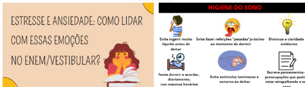
Figura 2 e 3 - Recorte dos slides sobre “Ansiedade e Estresse em época de ENEM e Vestibular

5º encontro: A ansiedade e o estresse são emoções recorrentes em pré-vestibulandos e podem, por muitas vezes, atrapalhar o desempenho e os resultados nos exames e vestibulares. Desse modo, o encontro, com o tema “Ansiedade e Estresse em época de ENEM e Vestibular: Como lidar?” teve como material de apoio o uso de slides, como ilustrados nas Figuras 2 e 3.