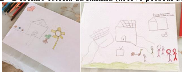
Imagem 2 - Desenho estória da família

Após finalizada a técnica principal, realizou-se uma atividade lúdica de desenho livre da família para encerrar o encontro, ilustrada na Imagem 2. Esta técnica foi conduzida da seguinte forma: com a utilização de papéis e lápis preto e de colorir, solicitou-se das participantes que fizessem um desenho da família, da forma que quisessem e como conseguissem. A partir disso, notou-se alguns temas diante dos elementos presentes nos desenhos, como por exemplo, a importância da religiosidade para as duas participantes, bem como, elementos de lazer e do cotidiano familiar.