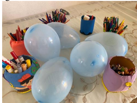
Imagem 1 - Técnica dos balões temáticos

Porém, a técnica precisou ser adaptada devido a presença de um bebê na sala e, por conseguinte, não se utilizou os balões.