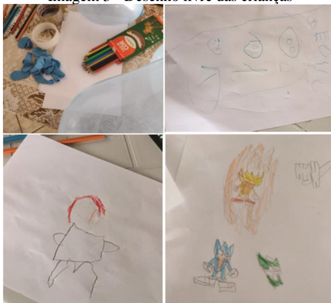
Imagem 3 - Desenho livre das crianças