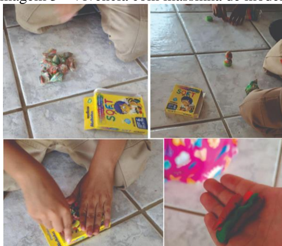
Imagem 5 - Vivência com massinha de modelar

A massinha de modelar, ilustrada na Imagem 5, desempenha um papel relevante no processo de desenvolvimento das crianças, proporcionando uma experiência sensorial e educacional. Ao ser apresentada para as crianças, elas se mostraram interessadas em criar objetos e ferramentas a partir da massinha.