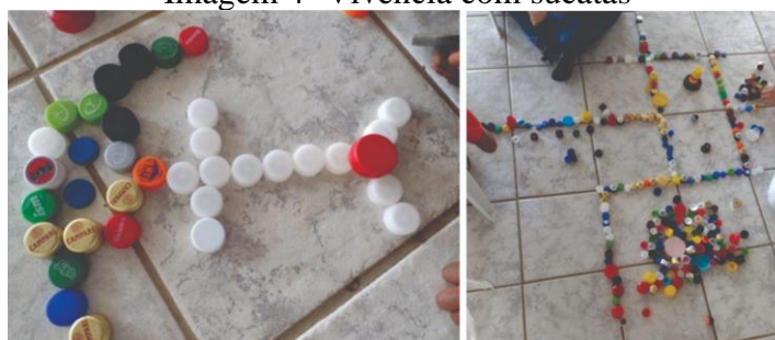
Imagem 4 - Vivência com sucatas

O quarto encontro foi destinado ao grupo de vivências com crianças, que tinha a intenção de identificar situações e habilidades que estão presentes ou são esperadas pelos responsáveis na interação com as crianças. Em função de não surgirem novos membros no grupo, não houve a necessidade de uma técnica de apresentação e, por conseguinte, iniciou-se às atividades utilizando a proposta de vivência com sucatas e massinha de modelar (Imagem 4). Com esse roteiro, esperava-se proporcionar um momento significativo, propício para descobertas, criatividade e o enriquecimento da experiência das crianças e fomentando o desenvolvimento das suas habilidades. Além disso, a utilização das sucatas proporciona uma variedade de possibilidades para o brincar infantil, influenciando de maneira assertiva no desenvolvimento motor, cognitivo, psicológico e social da criança, enfim, suas potencialidades.