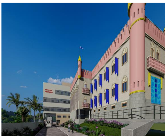
FOTO 1. HOSPITAL DA CRIANÇA, “CASTELINHO” DO HOSPITAL GERAL PRADO VALADARES, JEQUIÉ, BAHIA

em forma de castelo dos príncipes e princesas da Disney World e que só por essa faixa arquitetônica, tem se constituído num fator de mitigação dos temores das crianças quanto a estar num ambiente hospitalar, conforme testemunham alguns profissionais desse espaço ( Foto 1 ).