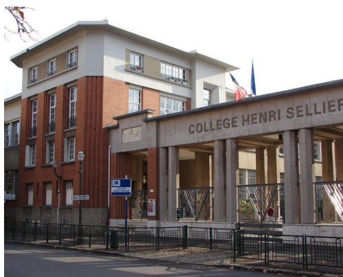
FOTO 3. COLLÉGE HENRI SELLIER ATUALMENTE