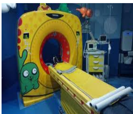
Sala de Ressonância