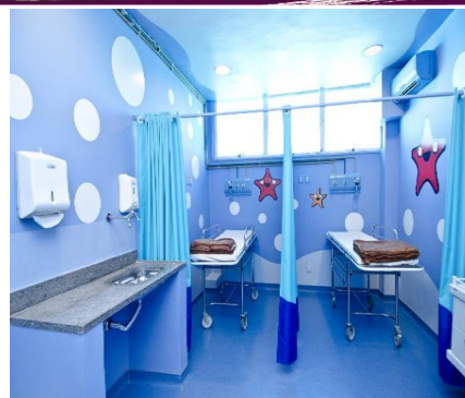
Sala de Observação