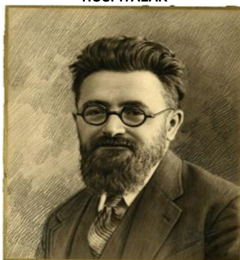
FOTO 2. HENRY SELLIER (1883 – 1943), PIONEIRO DA CRIAÇÃO DA CLASSE HOSPITALAR