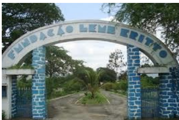
FOTO 6. PÓRTICO DE ENTRADA DA FUNDAÇÃO LEUR BRITO

fraldas e materiais para a realização de curativos. Depois, com a supervisão da psicóloga que detectará a baixa estima desse público, eles organizaram as iniciativas do projeto “Um dia de princesa” que ofereceu serviços de cabeleireiro, maquiagem, manicure e massagem aos idosos e, ademais, também, organizou – para após da prestação de tais serviços – que fossem tiradas fotografias em 4x3 desses, para serem exibidos o antes e o depois.