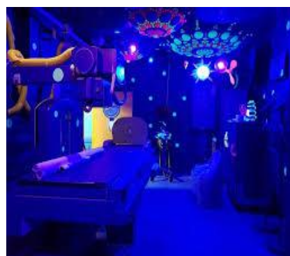
Sala de Raios X