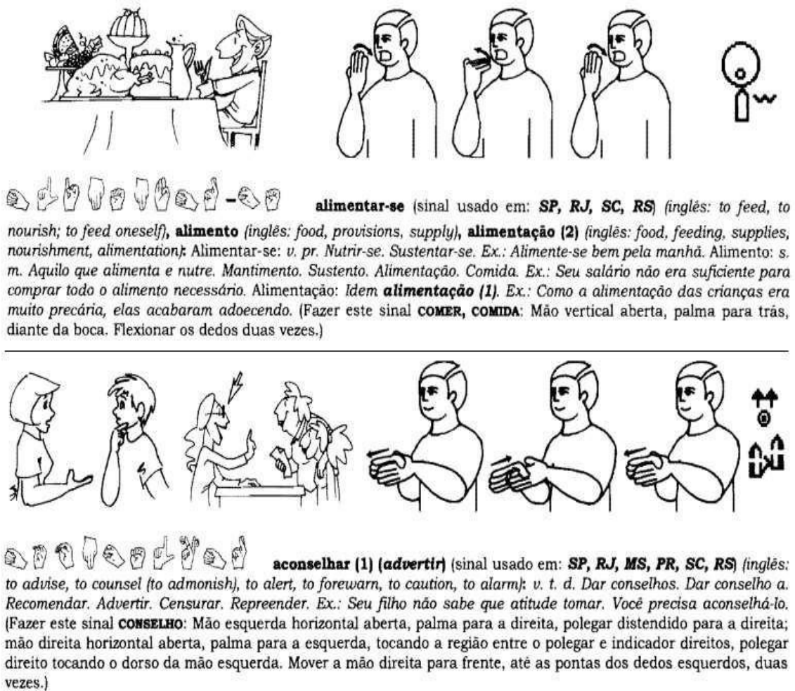
FIGURA 1 – Verbetes ‘alimentar-se’ e ‘aconselhar’

Fonte: Capovilla et al (2011), p. 161 e 2012