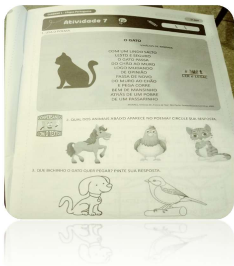
FIGURA 2 Atividade do caderno de português Lycecium

Ainda com base no texto trabalhado pela professora, podemos constatar que o gênero textual apresentado pela professora é uma porta aberta para trabalhar a consciência fonológica. Morais (2012) destaca que desde pequenas as crianças brincam com as palavras fazendo reflexões fonológicas. E uma das formas que pode trabalhar a consciência fonológica é por meio dos poemas, por ser um gênero que contém rimas. A consciência fonológica é uma atividade preditora para o aprendizado da leitura e da escrita.