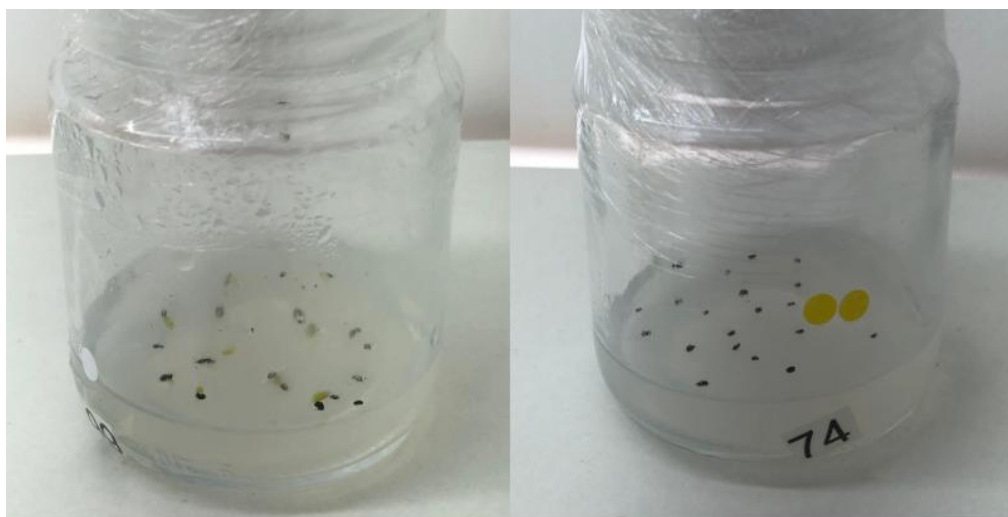
Figura 1. Sementes de P. cattingicola subsp. salvadorensis em diferentes meios de cultivo.