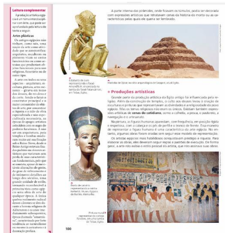
FIGURA 2: Reprodução do recorte do livro Historiar sobre a reforma amarniana.