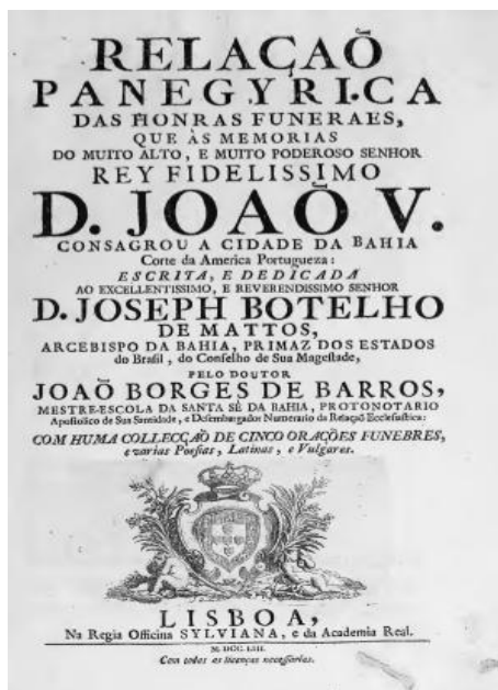
FIGURA 1: Portada do livro