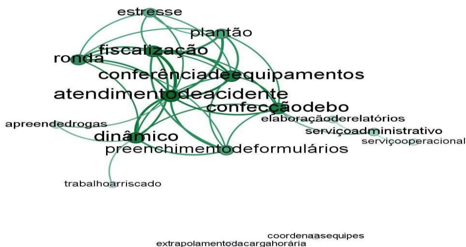
FIGURA 1 - Atividades Operacionais e Estresse Ocupacional

Uma análise das redes semânticas permite compreender o cotidiano policial. A Figura 1 mostra que a rotina dos policiais inclui tarefas operacionais, como atendimento de acidentes, rondas e fiscalizações, e atividades burocráticas, como preenchimento de formulários e confecção de boletins. Essa combinação evidencia um trabalho com alto nível de responsabilidade, contato com situações de risco e acúmulo de funções, gerando desgaste físico e emocional. Termos como “estresse”, “ronda” e “plantão” indicam demandas imprevisíveis e impactos na saúde. A falta de eficiência, a centralização de processos e a ausência de medidas institucionais específicas intensificam o estresse ocupacional.