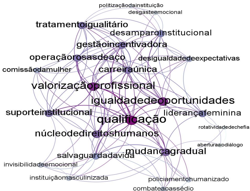
Figura 1 – Ambiente policial sob a perspectiva de gênero

transformação institucional. Ela aparece conectada a expressões como “suporte institucional”, “núcleo de direitos humanos” e “combate ao assédio”, o que aponta para uma compreensão de que o aprimoramento técnico deve caminhar junto à formação ética, humanizada e comprometida com os direitos fundamentais. Rosaneli (2015) argumenta que o empoderamento só se concretiza quando promove autonomia e transformação, capacitando indivíduos e grupos a enfrentar estruturas de opressão. No contexto policial, essa formação também envolve preparo para lidar com adversidades emocionais e sociais.