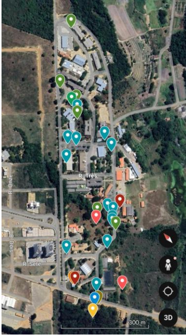
FIGURA 1: Mapa de ninhos naturais de abelhas sem ferrão registrados no campus da UESB.