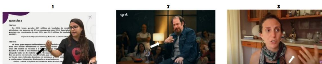
FIGURA 1 – OCORRÊNCIAS DE GESTOS EM CONTEXTOS DISTINTOS

Foram escolhidas 3 ocorrências como amostra, sendo uma de cada contexto de uso descrito por Ladewig(2014): busca por palavras ou conceitos, solicitação e descrição, isso pode ser observado na figura 1 a seguir: