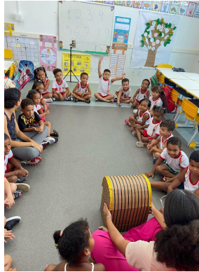
Imagem 02: Crianças explorando o baú mágico