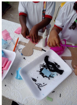
Imagem 5: Auto retrato: Meu Boneco Especial