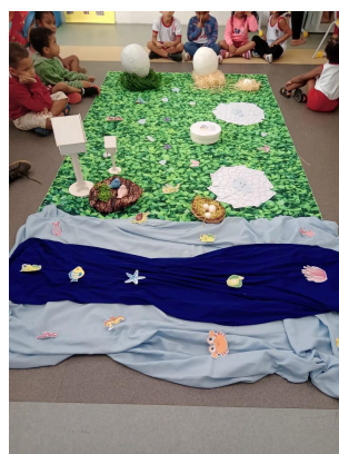
Imagem 7 – Estação de Observação: Mundo dos Ovos e Fundo do Mar