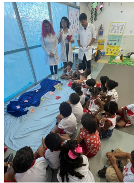
Imagem 9 – Roda de conversa e escuta das hipóteses infantis