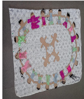
Imagem 6: Exposição de Bonecos

Fonte: Acervo pessoal das autoras, 2025.