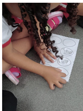
Imagem 10 – Atividade de registro das hipóteses Imagem 11 – Produção individual com lápis de cor

As falas das crianças mostraram um universo de descobertas e imaginação. Elas rapidamente associaram a figura do ovo a animais como “tartaruga”, “tartaruga marinha” e “dinossauro”. A grandiosidade dos ovos de dinossauro chamou a atenção, com um dos alunos comentando “os ovos dos dinossauros eram grandões!”. Podemos observar algumas produções nas imagens abaixo: