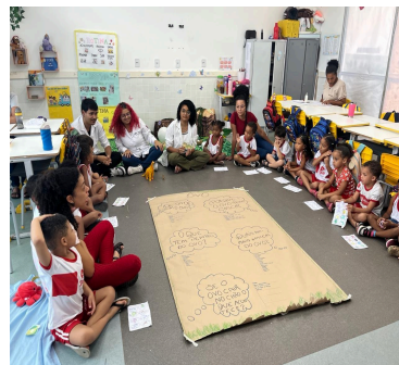
Imagem 8 – Registro inicial da turma com as pibidianas