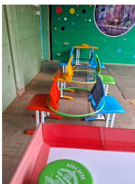
(Anexo 1 - Arquivo pessoal).

Nesse aspecto, promoveu-se também atividades de psicomotricidade que os discentes gostavam muito, a exemplo, do anexo 1.