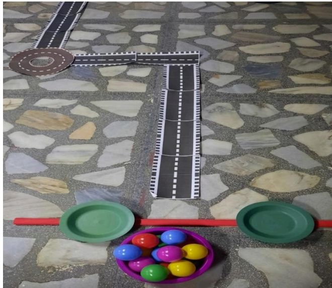
Figura 1 – Trilha do Equilíbrio