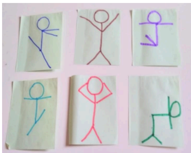
Figura 6 - Brincadeira Corpo e Movimento

Essa brincadeira estimula a capacidade da criança de identificar e reconhecer, em si e no outro, os sentimentos por meio da expressão corporal. O professor organiza um círculo com os alunos e apresenta cartões ilustrativos para que eles interpretem e expressem os sentimentos indicados por meio de gestos. A atividade promove o desenvolvimento sócio emocional, incentivando o autoconhecimento e a expressão das emoções, além de fortalecer o sentimento de pertencimento à comunidade escolar.