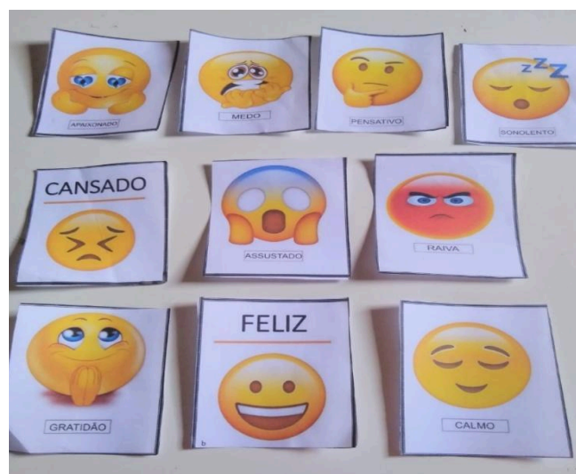
Figura 5 - Brincadeira Gestos e Movimento

O ato de arremessar as argolas exige coordenação motora, promovendo o aprimoramento das habilidades motoras finas. O desafio de acertá-las no pedestal estimula a coordenação olho-mão, contribuindo para a precisão dos movimentos. O professor distribui as argolas e organiza as crianças em fila para que arremessem uma de cada vez. Vence quem acertar o maior número. Trata-se de uma prática que trabalha o foco visual, a atenção, a concentração e o equilíbrio, sendo essencial para o desenvolvimento da percepção corporal.