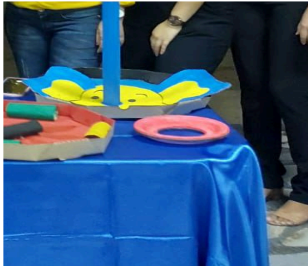
Figura 4- Jogo das Argolas " Orelha de Elefante"