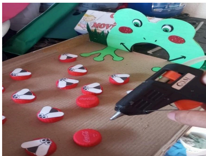
Figura 3- Sopra Mosca

A proposta visa desenvolver o pensamento rápido, a capacidade de ação imediata e a concentração, contribuindo de maneira lúdica para o aumento do foco nas atividades.