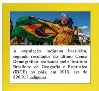
Ilustração I: Painel retratando o jogo da memória sobre agricultura indígena, produzido em Vitória da Conquista/BA, 2025.

Na ilustração I do painel abaixo, mostram-se os cartões elaborados pensados para a temática da agricultura indígena, considerando-se também aspectos legais que envolvem os povos originários.