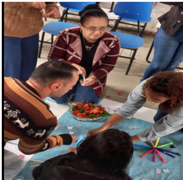
Figura 2: professores explorando elementos lúdicos