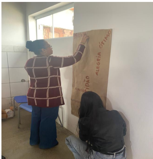
Figura 3: Professoras desenvolvendo uma atividade da oficina