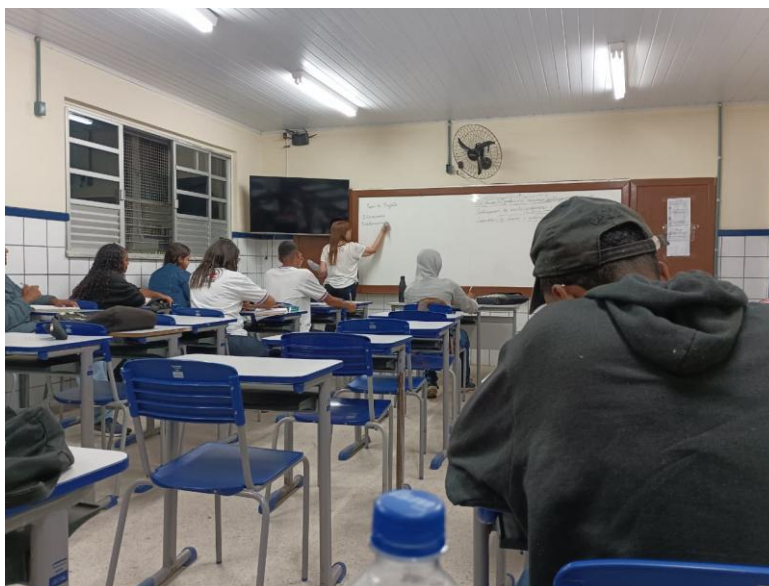
Figura 1. Observação da sala de aula do 3º ano TJ

vivência docente possibilitou um processo de formação teórica, observação na escola, produção de material para a prática e, por fim, a prática em si.